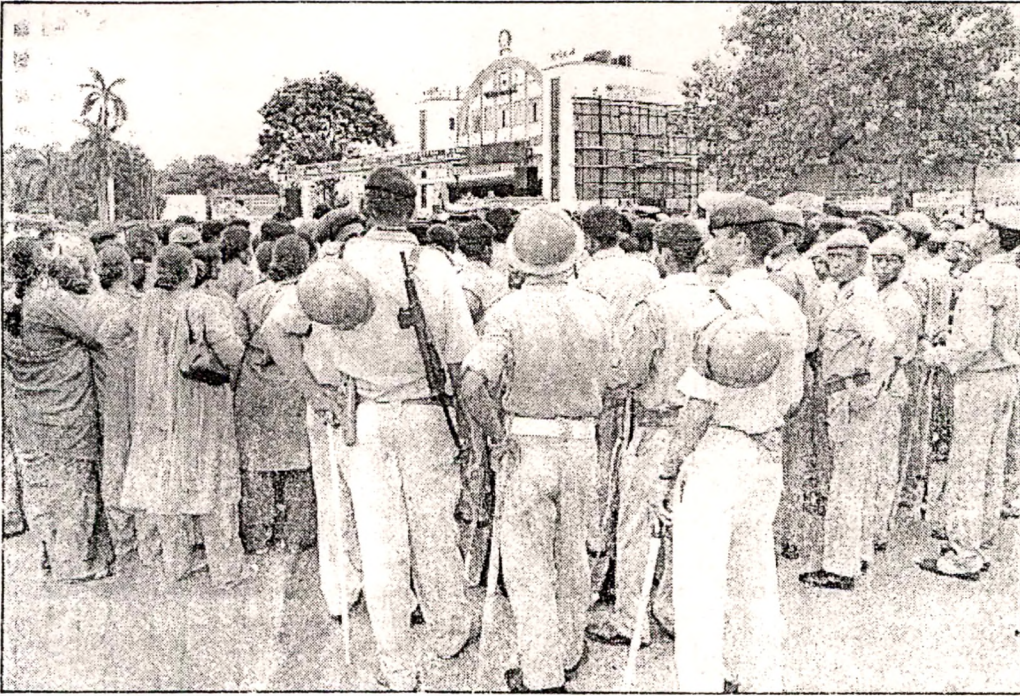
રથયાત્રા બંદોબસ્ત : અપાઢી બીજની રથયાત્રાની પૂર્વ સંધ્યાએ શહેર પોલીસ તંત્ર દ્વારા રથયાત્રા રૂટ પર રિલેસ કરી સબ સલામતની ભાવના પ્રબળ બનાવી હતી. શહેર પોલીસ તંત્રની મદદમાં અર્ધલશ્કરી દળોની કુમક બોલાવાઈ છે.