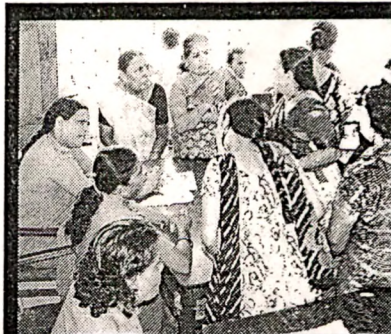
Police personnel talk to aggrieved women at the Mahila police station.