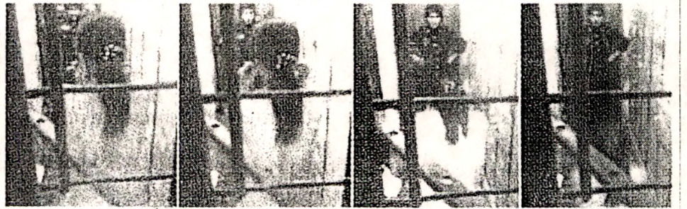
મલેશિયાના પાટનગર કુઆલાલમ્પુરના પોલીસ મથકમાં એક મહિલા પોલીસ અધિકારીએ ચીની મહિલાને નગ્ન કરીને તેની સાથે ખરાબ વર્તન કરતી આ વીડિયો ક્લિપમાં જોઈ શકાય છે. આ દટન થી દેશભરમાં ચકચાર મચી ગઈ છે. • એએફપી

આ ક્લિપિંગ એ વાતને સમર્થન આપે છે કે મલેશિયન પોલીસ યાઈનિઝ મહિલાઓનું શોષણ કરે છે. સંપૂર્ણ નગ્ન અવસ્થામાં પોતાના બંને કાન પકડી ઊઠબેસ કરતી આ મહિલાનું જેલમાં