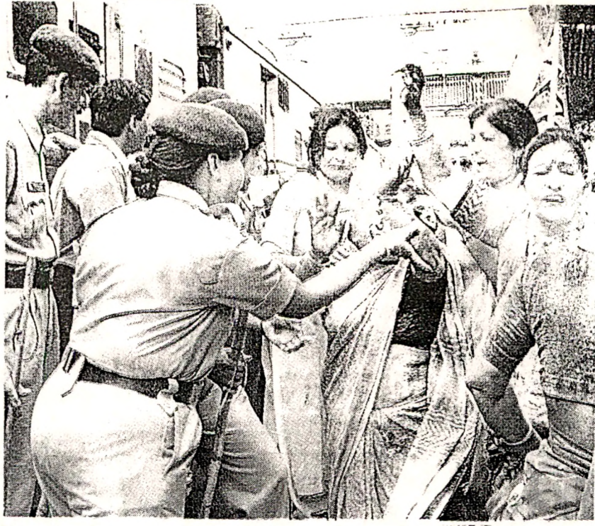
ભા.જ.પા. દ્વારા પેટ્રોલ - ડીઝલના ભાવ વધારાના વિરોધમાં બુધવારે આપવામાં આવેલા રેલ રોકો આંદોલનને પગલે વડોદરા રેલવે સ્ટેશન ખાતે, ઉશ્કેરાયેલી મહિલા કાર્યકરોને કાબૂમાં લઇ રહેલી મહિલા પોલીસ